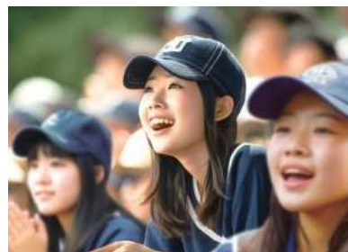
写真:イメージです

皆様からいただいたご支援 ※1 (1口5万円～)で地域の子供たち ※2 を神戸2024世界パラ陸上に招待します。